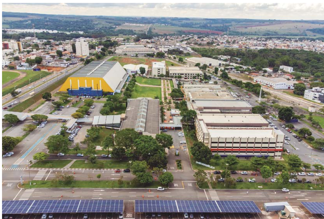
A UniEvangélica tem uma das maiores logísticas esportivas de Goiás e recebe competições de várias modalidades

O cronograma continua em fevereiro, com o INTERUNI - Seletiva de Futebol, no campo da universidade. Esta etapa é considerada uma peneira de atletas da instituição que competirão