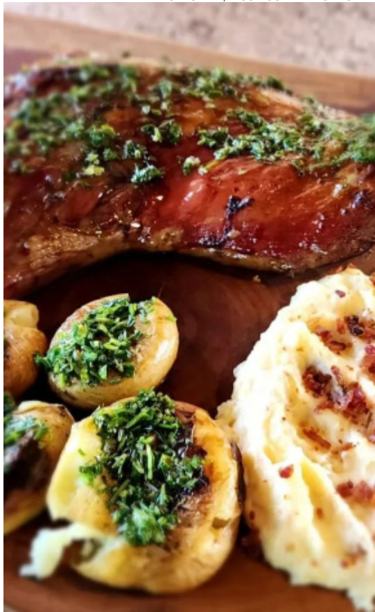
Rústico Premium Grill, localizado na charmosa Vila de São Jorge: destino ideal