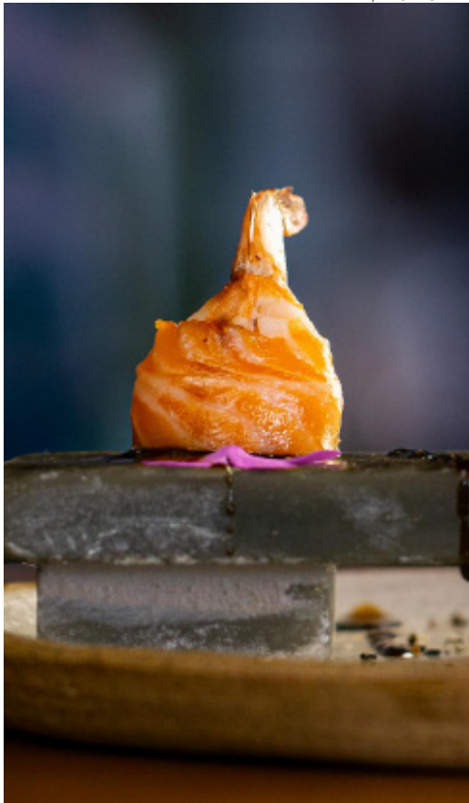
Haikai, na cidade de Pirenópolis: caminho sem volta

Na busca por destinos que unam experiências gastronômicas excepcionais e ecoturismo, a Chapada dos Veadeiros, em Goiás, surge como uma opção irresistível. Entre os inúmeros estabelecimentos da região que encantam os turistas apaixonados por boa comida, eu destaco o Rústico Premium Grill, localizado na charmosa Vila de São Jorge. O restaurante chama a atenção por seu menu defumado, que conquistou meu paladar com opções irresistíveis. Dentre os destaques, o Galetto Defumado, que vem acompanhado de salada de batata e farofa, as suculentas Pork Ribs Defumadas, uma costela suína que acompanha batata frita e serve até duas pessoas e o Hambúrguer Rústico Defumado, um blend de aioli, cheddar, abacaxi assado e pão brioche com gergelim prometem uma experiência gastronômica única.