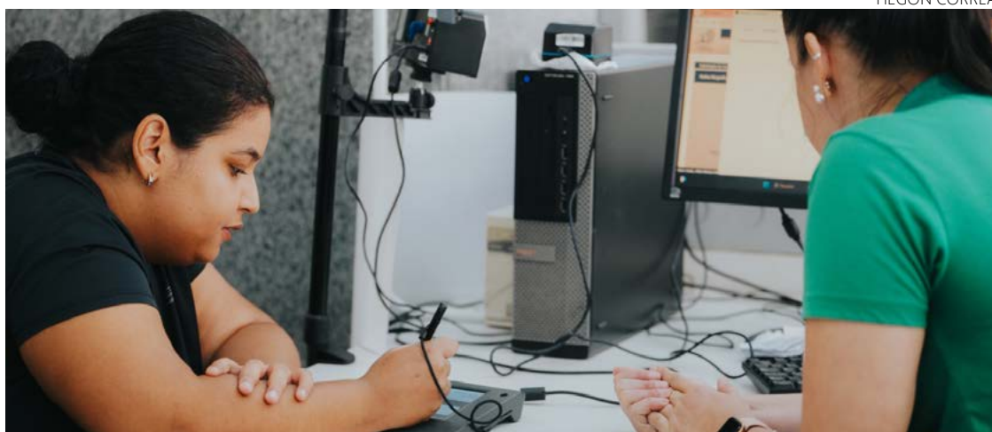
Serviço prestado no Vapt Vupt: novo documento possibilita mais verificações de segurança e busca prevenir fraudes

Os novos documentos unificam os cadastros administrati-