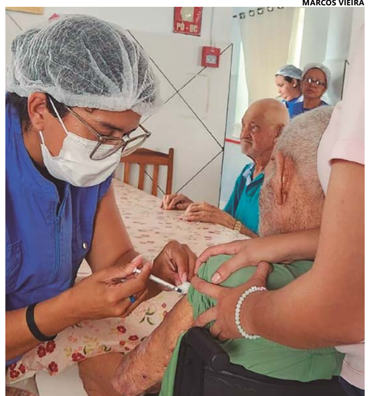
Agora, no dia 18 de janeiro de 2024, moradores do Abrigo Nicephoro Pereira recebem doses da vacina Bivalente, reforço contra a doença

Ao longo da pandemia, a Prefeitura de Anápolis também reservou uma unidade de saúde e criou um hospital de campanha, o Norma Pizzari, especialmente para atender pacientes com Covid-19. O poder público municipal também contratou leitos de UTI para que a população local não entrasse na fila estadual e tivesse atendimento em casos de agravamento da doença. Todo o sistema foi considerado um dos mais organizados no combate à pandemia.