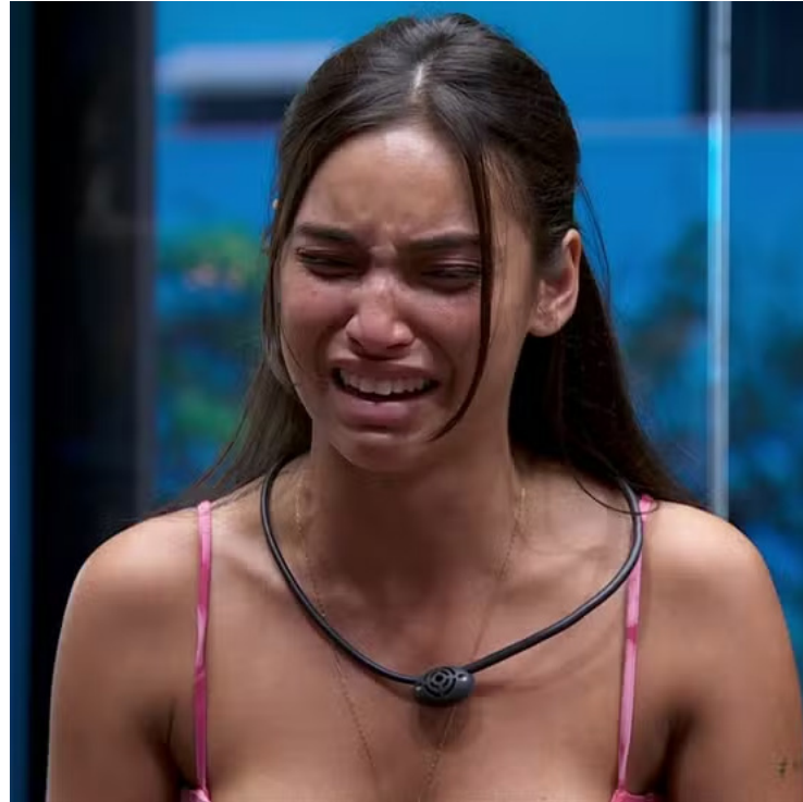
Espectadores apontaram semelhança com personagem de nova