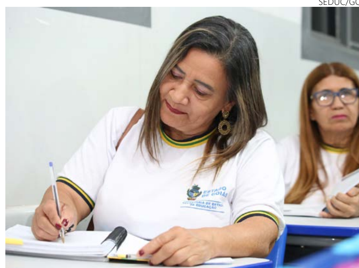
Alunos da Educação de Jovens e Adultos da rede pública estadual de ensino

Para quem deseja concluir os estudos de forma on-line, há também a possibilidade de se matricular na EJAtec. As aulas desta modalidade ocorrem no formato semipresencial, sendo que 80% são realizadas na plataforma Moodle e 20% na unidade escolar.