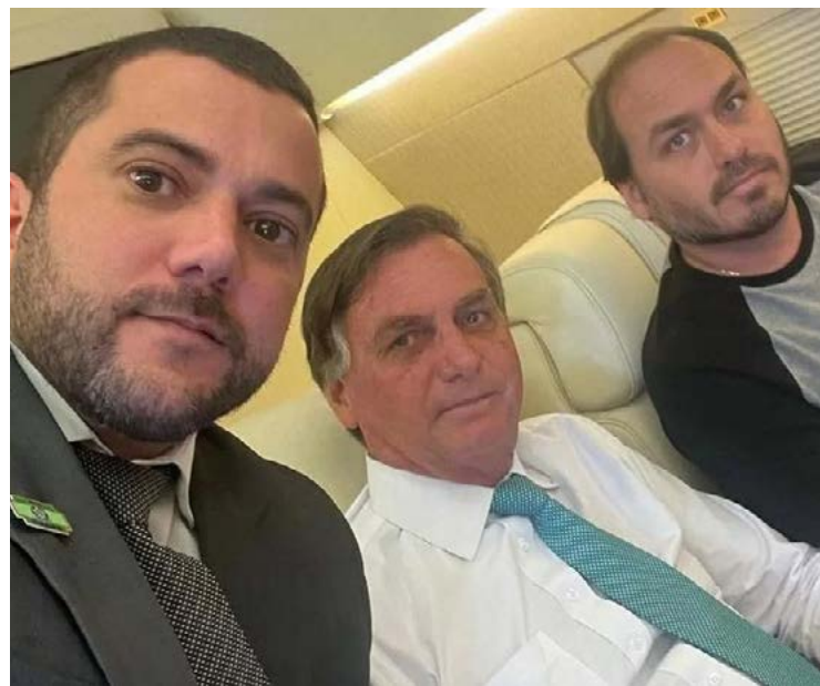
Carlos Jordy (PL/RJ) e Jair Bolsonaro (PL): acusação de contribuir com os atos golpistas

As suspeitas relacionadas a Jordy incluem eventos de teor antidemocrático ocorridos no Rio de Janeiro, incluindo acampamentos em frente a quartéis das Forças Armadas e bloqueios de rodovias, após as eleições de 2022.