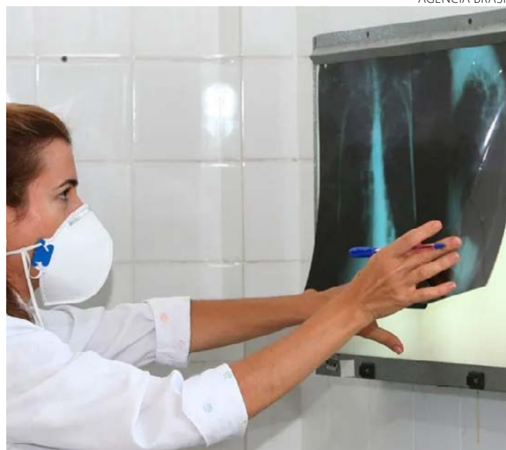
48% das famílias brasileiras afetadas pela tuberculose tiveram “custos catastróficos” relacionados ao tratamento

Além disso, os custos foram mais frequentes em portadores de HIV e pessoas autônomas (self-employee). Por outro