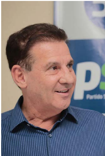
Senador Vanderlan Cardoso