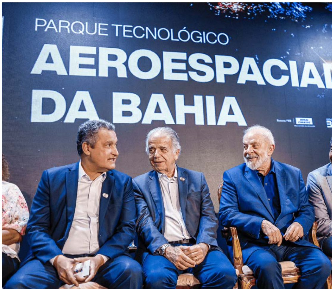
Lula da Silva: maratona de visitas aos estados começa pela Bahia, de olho nas eleições municipais

Em 1808, foi assinado documento determinando a criação da Escola de Cirurgia da Bahia, que em 1832 passaria a se chamar Faculdade de Medicina da Bahia. As universidades brasileiras surgiram no século 20.