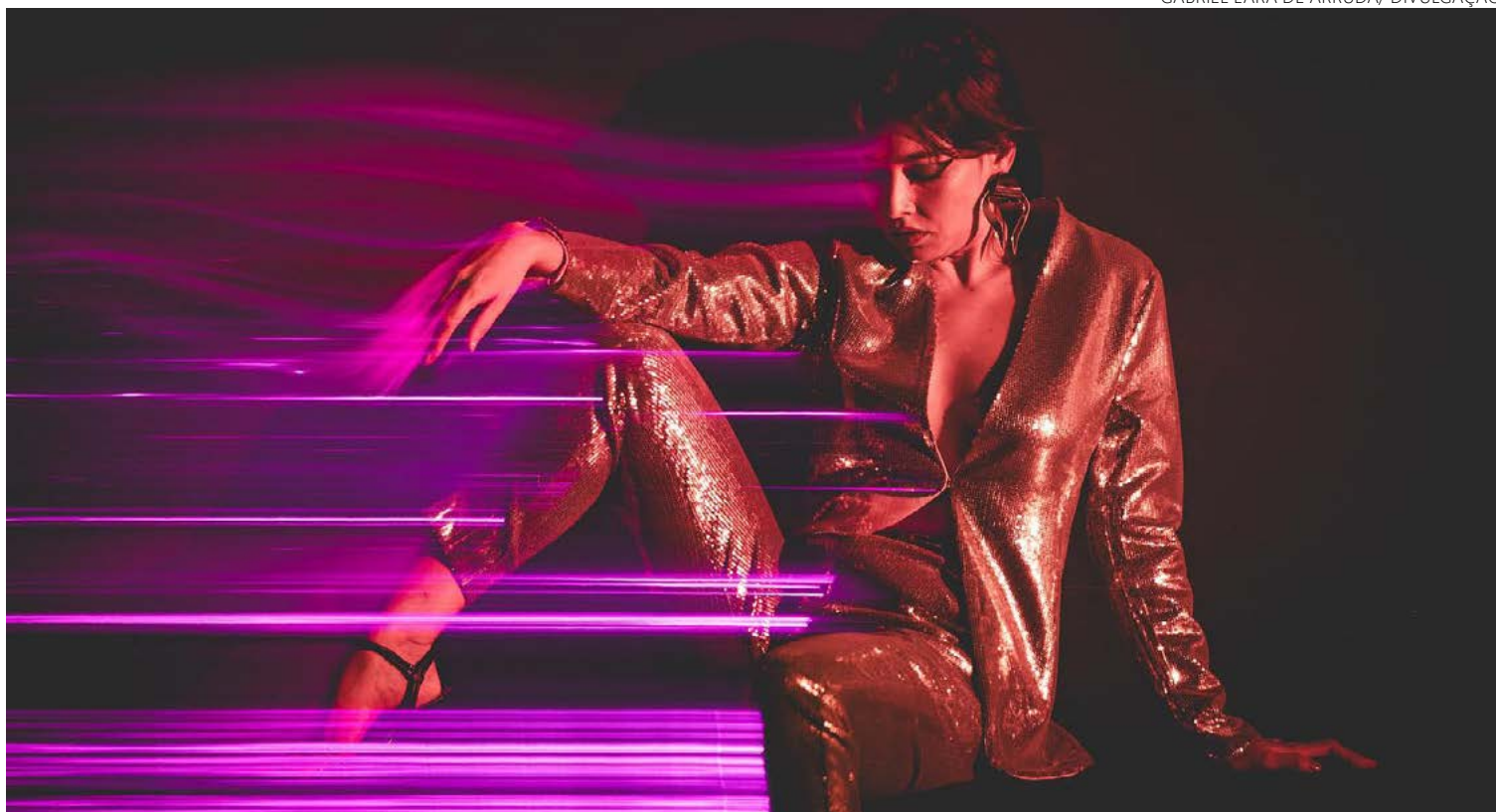
Vocalista Salma Jô é clicada em imagem de divulgação do single “Noites Tristes”

Poesia, como vemos, há. E de sobra. Atente-se para os versos de “Comida Amarga”, canção do disco “Tônus”, lançado em 2018: “Nenhum disfarce no teu olhar/ eu já venci, já não sou mais gostosa/ Você goza triste em mim”. Ou, se preferir, veja o que Salma tem a nos falar na erótica “Amor Distraindo (Durin)”, do mesmo disco: “Cê vem macio, cê vem durin/ Relaxa, encaixa, engata em mim, me bota sem apoio/ Seu corpo é meu apoio pra eu deixar cair/ Sem me machucar muito” Quem não gosta de gozar em alto e bom som,