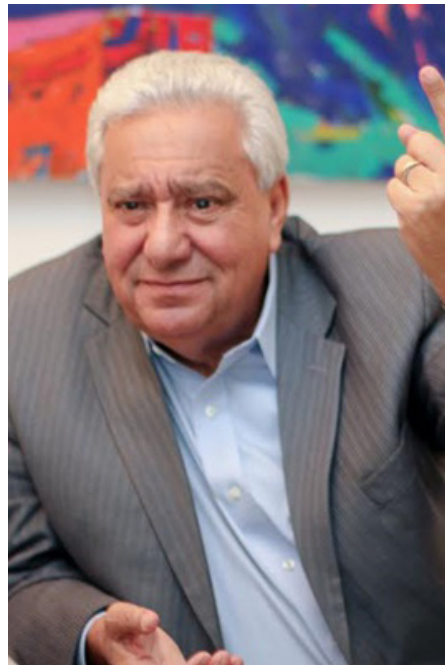
Ex-deputado Vilmar Rocha