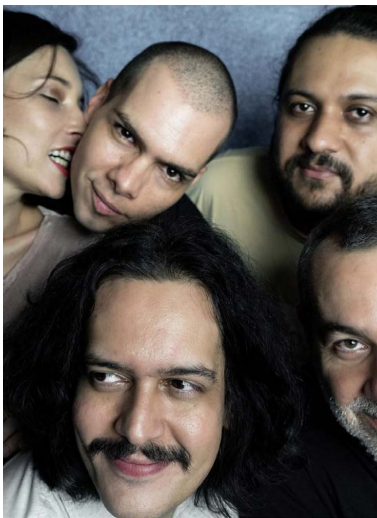
Carne Doce, destaque no cenário alternativo: psicodelia e pós-tropicalismo