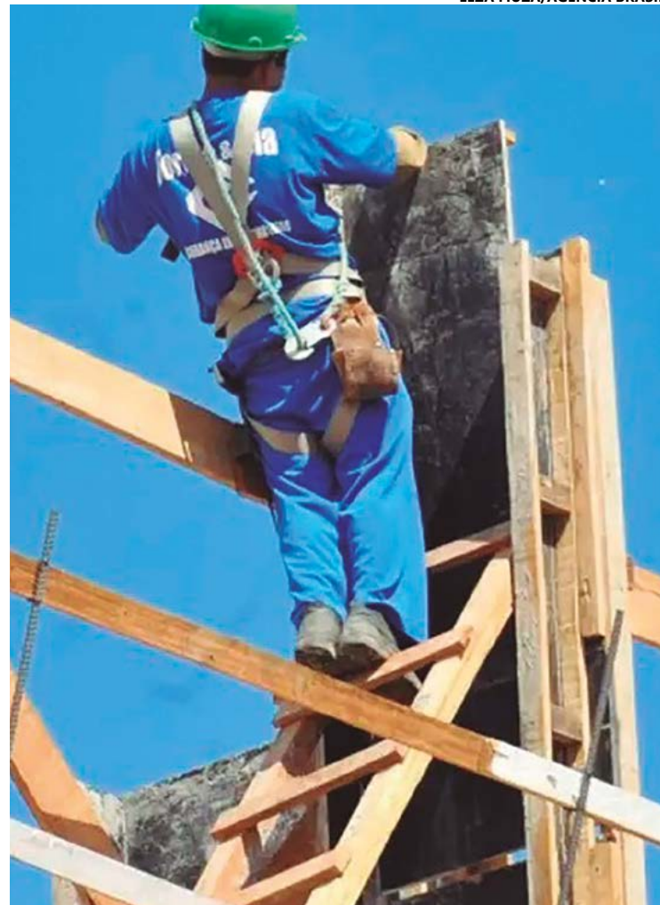
Engenheiro de segurança no trabalho diz que Brasil é o 4º país no ranking mundial desse tipo de acidente, registrado a cada três horas e 40 minutos